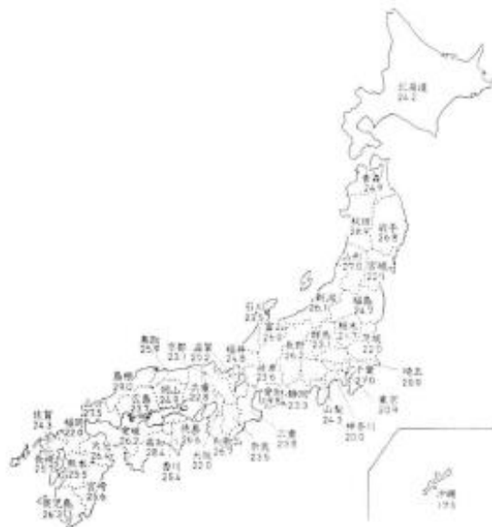
資料2 都道府県別65歳以上人口の割合 (%)